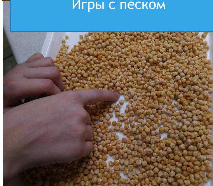
Игры с крупой