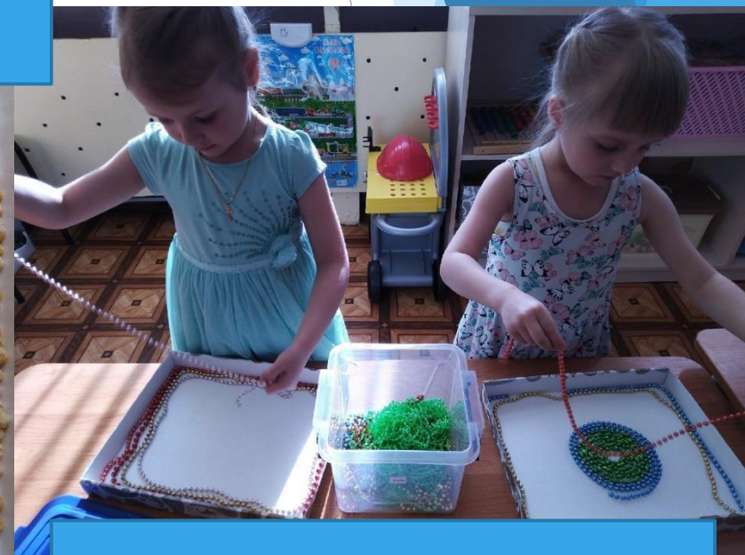
Игры с бусами