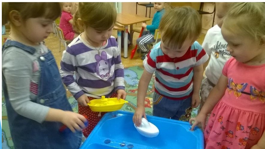
Игры с водой