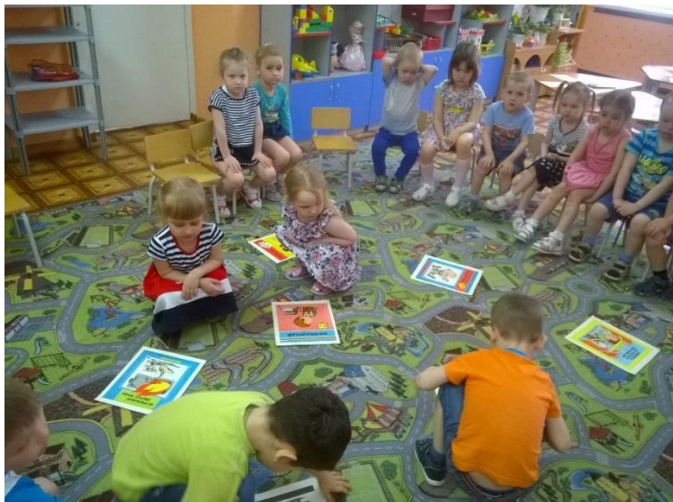
Работа в паре