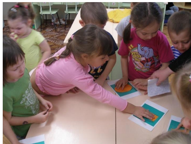
Работа в подгруппе